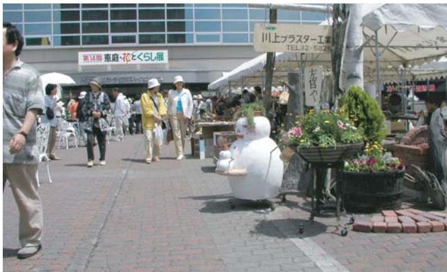
▲リサーチビジネスパークセンター前庭で行われた「花とくらし展」。官民共同で実行委員会を組織化して開催している。