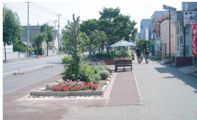
▲都市計画道路(南島松1号通)の計画幅員16mより更に広く、歩道と花壇用地8mを確保した箇所。沿線の恵み野商店会や「花の千人植え」で管理している。