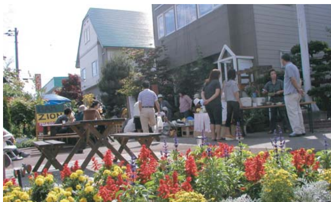
▲コンテスト実行委員による「花探偵団」の審査風景。