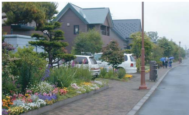
▲恵み野研究村の全景。電線地中化、道路の曲線化、建物の位置、色、植栽の統一などがわかる。