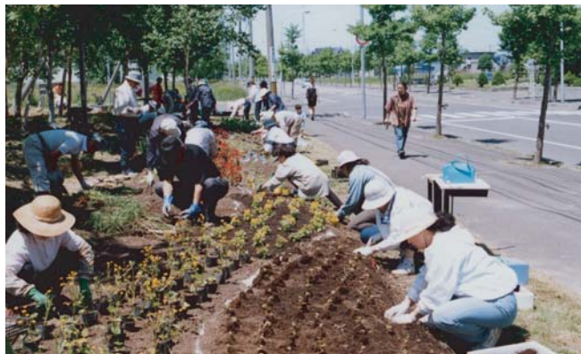
▲「花の千人植え」風景。JR恵み野駅から約3km、道路の両側を「花ロード」と名付け、自由参加で花を植える。