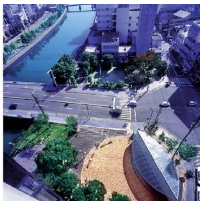
▲ 両国橋西詰 公園部分。直径24mの縁に囲まれた円周上に都市公園トイレを設置。