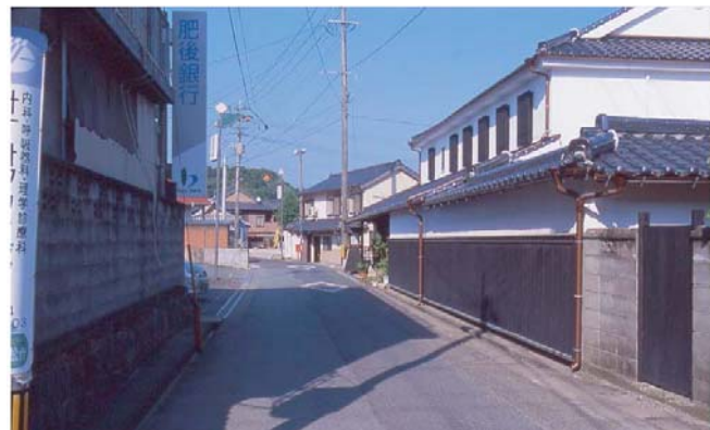
▲ 右側の建物は平成12年度に修景した家屋。