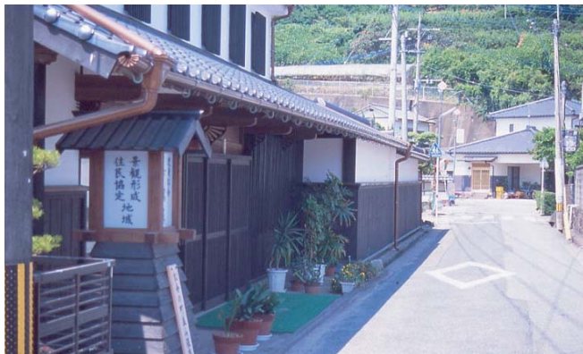
▲ 玄関横に立てられた標灯。