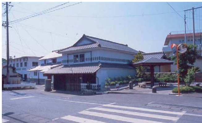
▲ 土蔵白壁修景家屋をバックにしたミニ公園。