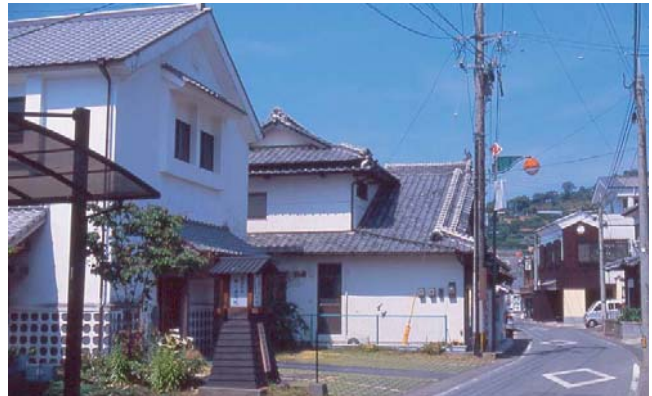
▲ 左側の土蔵白壁の建物がビジターセンター。