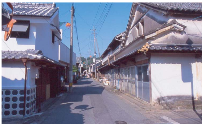
▲ 土蔵白壁の町並み。本通り中央付近。