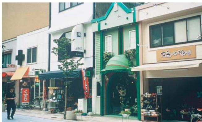
▲建物の外周をフレームで縁取る統一ファサード整備（基本カラーによる外壁・テント・統一サインなど）。