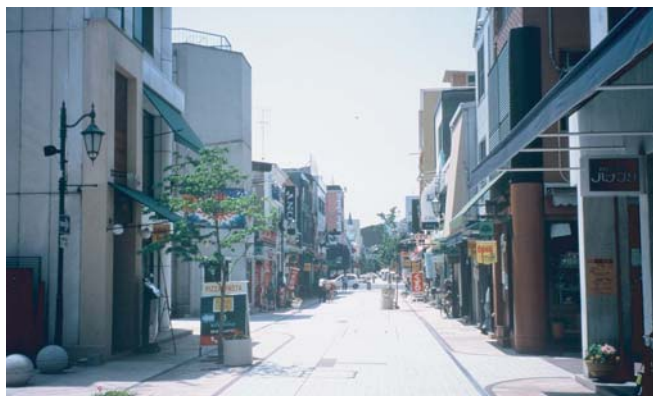
▲久松通りをJR福山駅側（北）より望む。