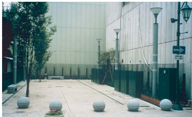
▲北ポケットパーク。全ての路上機能がコンパクトに設置されている。