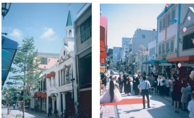
▲（写真左）シンボリックにファサード整備された自動演奏カリンオン付チャペル。 （写真右）整備された街路を活用したイベント風景。