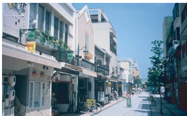
▲久松通りを中央公園側（南）より望む。